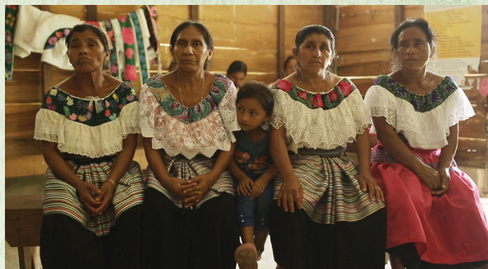
Lengua tseltal, Muquenal, municipio de Chilhón, Chiapas.

1 Elaboración: Dirección General de Culturas Populares, Indígenas y Urbanas (DGCPUIU), 2021.