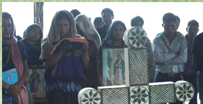
Lengua tsotsil, Acteal, municipio de Chenalhó, Chiapas.