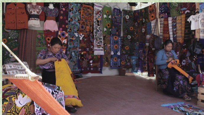
Lengua tsotsil, San Juan Chamula, Chiapas.