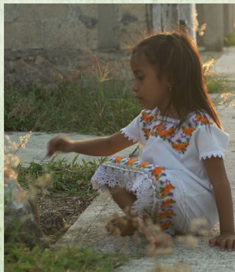
Lengua maya, Mérida, Yucatán.