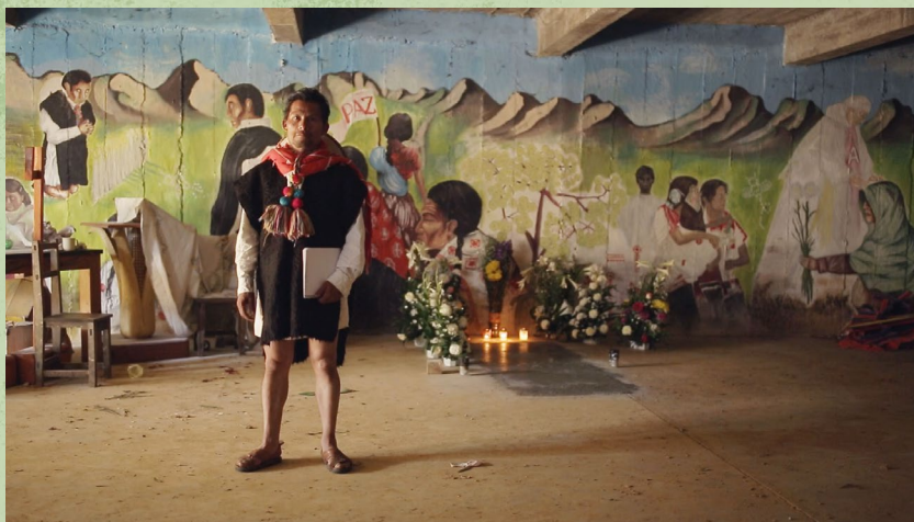
Lengua tsotsil, Acteal, municipio de Chenalhó, Chiapas.

Esta familia se habla desde México hasta Honduras. Se encuentra espacialmente muy bien delimitada y concentrada en el área donde se hablan sus lenguas, con excepción del tének, o huasteco, cuyos hablantes se localizan en los estados de San Luis Potosí y norte de Veracruz. En el mismo grupo en el que se ubica el tének también encontramos al chicomucelteco, lengua extinta.